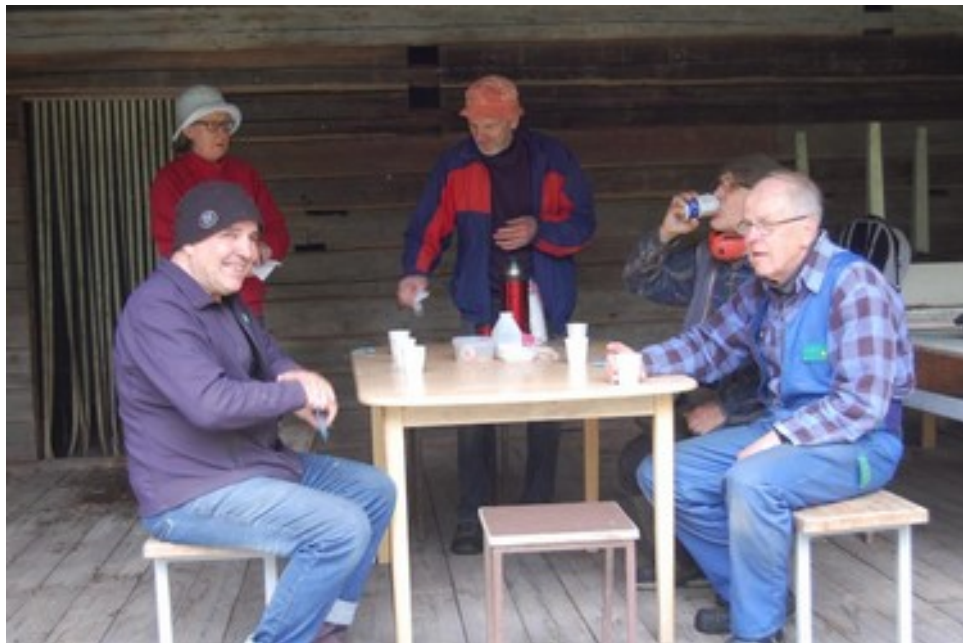
Voikukien kukoistettua päästiin pitkästä aikaa valmistelemaan Savulenkkiä ja se meitä suuresti ilahdutti.